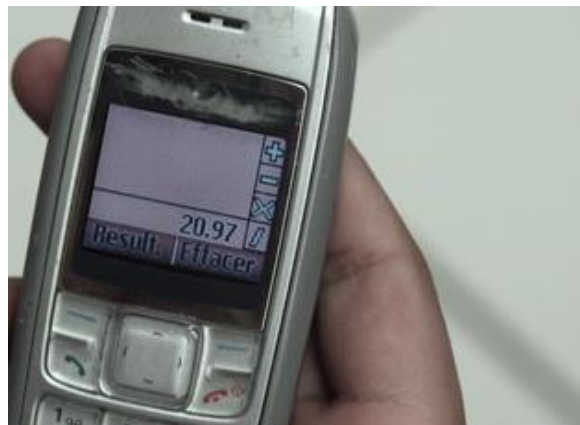
Très gros plan Shopping