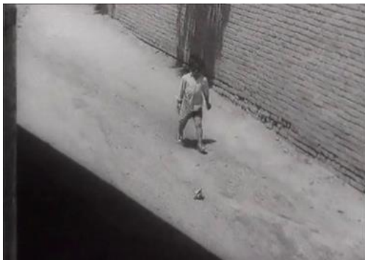
Le pain et la rue

Dans le cas de la plongée la caméra est placée plus haut que le sujet filmé. Dans le cas de la contre-plongée c'est l'inverse, la caméra est placée plus bas que le sujet filmé.