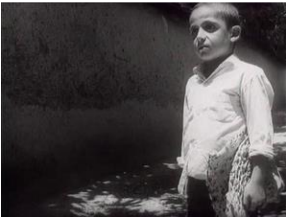
Plan américain Le pain et la rue