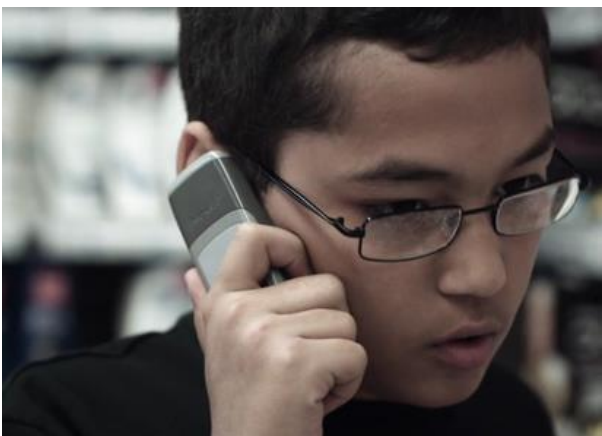
Gros plan Shopping