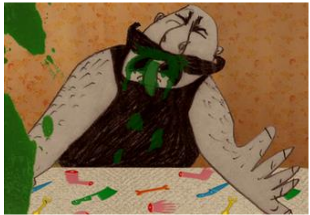
Plan rapproché La Saint Festin