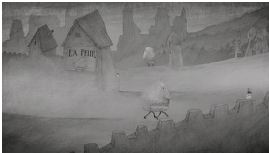
La grosse bête