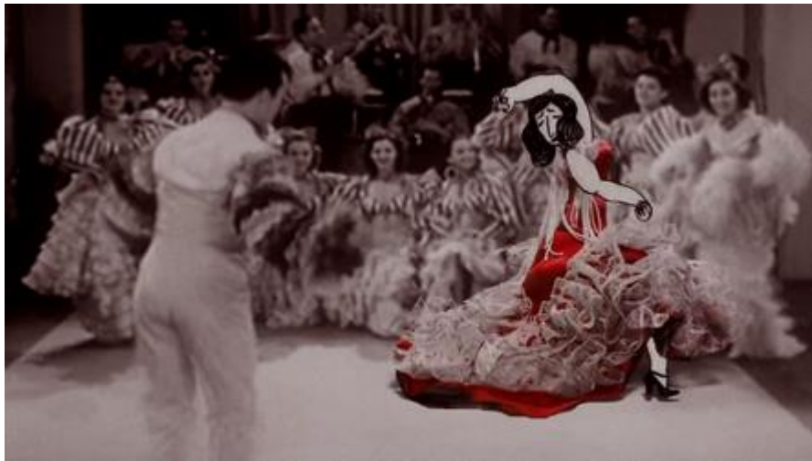
La Saint Festin

Ces termes désignent les zones de composition de l'image sur laquelle apparait un effet de profondeur : ce qui se trouve à l'avant (premier plan), au milieu (deuxième plan) et à l'arrière (arrière-plan).