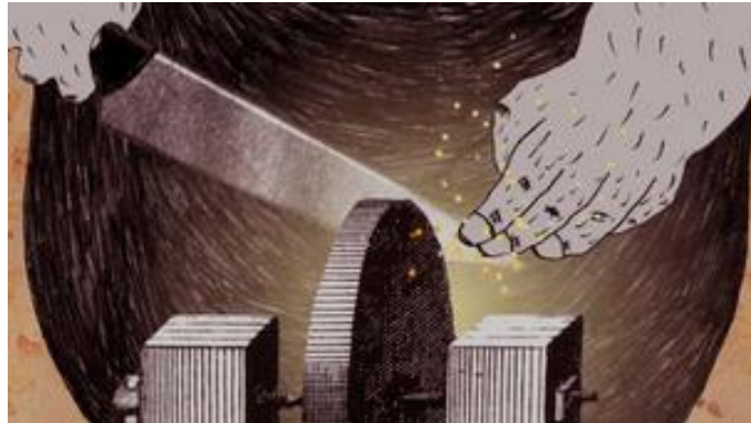
La Saint Festin

Le cadre suggère le HORS-CHAMP ou l'espace exclu du champ par le cadrage mais prolongé imaginativement.