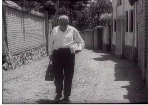
Plan moyen Le pain et la rue