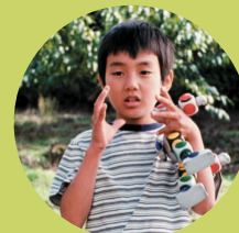
Charles ChaplinLee Jeong-hyang, Corée, 2002, 87 mn, couleur

Extrait du Cahier de notes de Charles Tesson