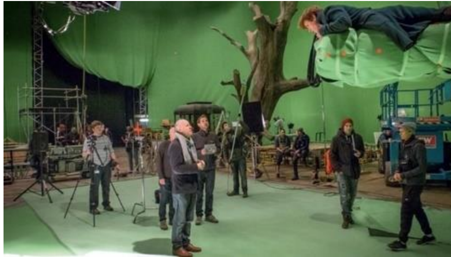
Le fond vert : effet visuel