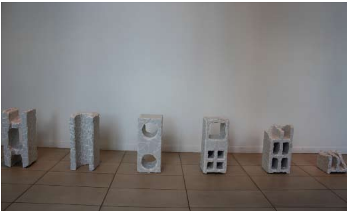
Ensemble Gaudi, 2014 Parpaing, mosaïque