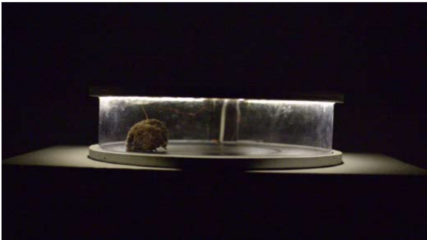
Mogwai, 2015 fourrure, moteur électrique, bande LED, plexiglas, encre conductrice, transformateur, contre-plaqué