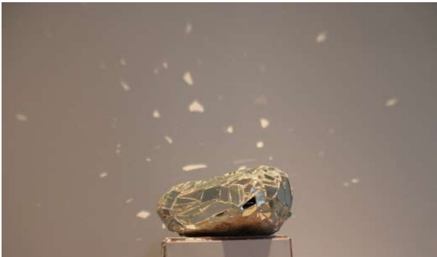
Galet disco, 2014 Galet, mosaïque miroir, spot lumineux