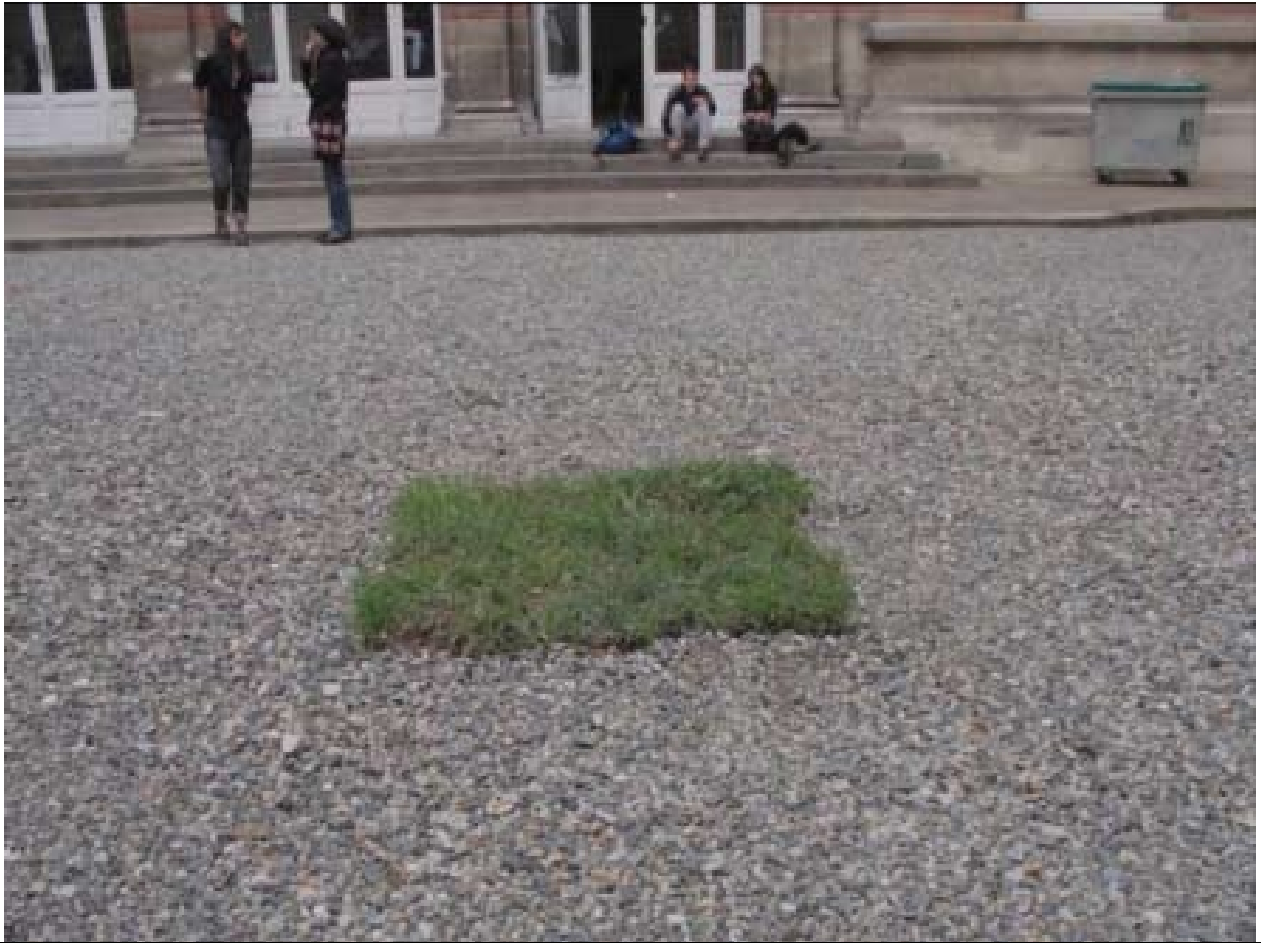
Un mètre carré d'herbe verte, 2008 extrait de paysage