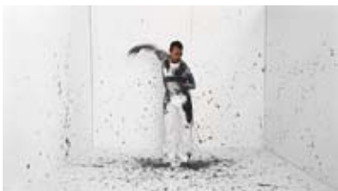
Performance painting, Nicolas Floch, Interprété par Rachid Ouramdane © Nicolas Floch