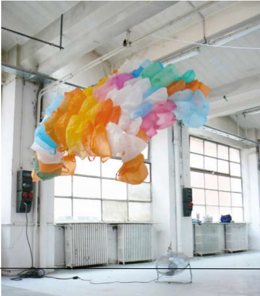
Aérodyne, 2010 sachets plastiques, nylon, ventilateur