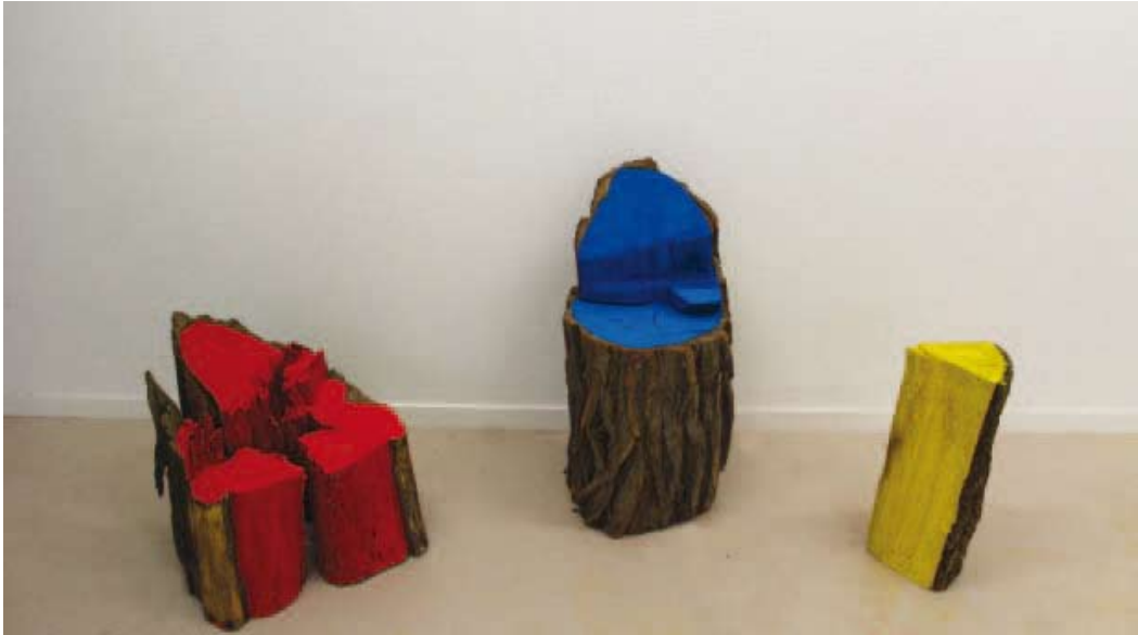
Rietveld, 2013 Vue d'atelier Installation troncs de bois et gouache, dimensions variables