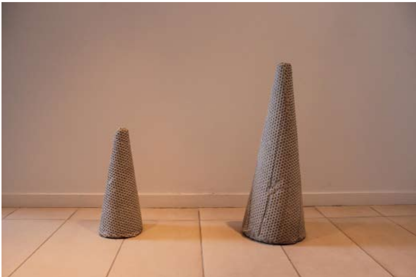
Stalagmitermites, 2014 mortier moulé